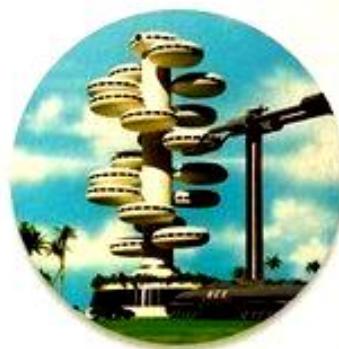
Ресурсо- ориентированная экономика

Ресурсо-ориентированная экономика — это система, в которой все вещи и услуги доступны без использования какого-либо товарно-денежного обмена (денег, бартера и т. п.)